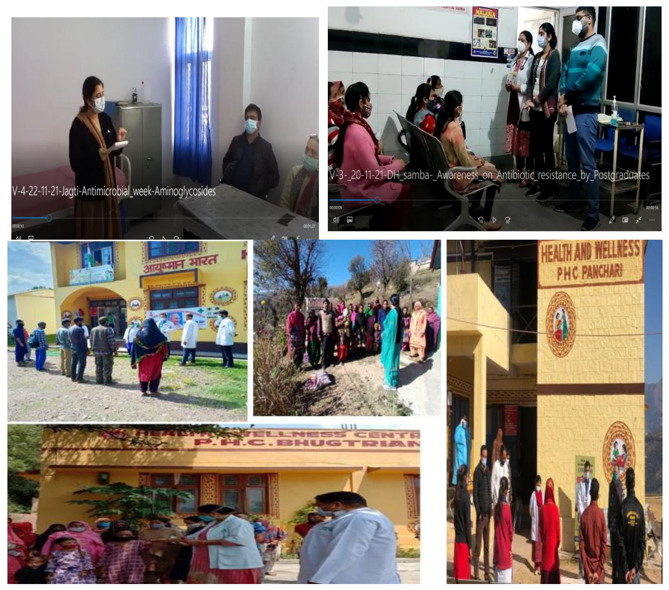
Lecture to healthcare providers at health and wellness centres by doctors about AMR

• IEC through Miking, Distribution of Pamphlets, Social media, Print media